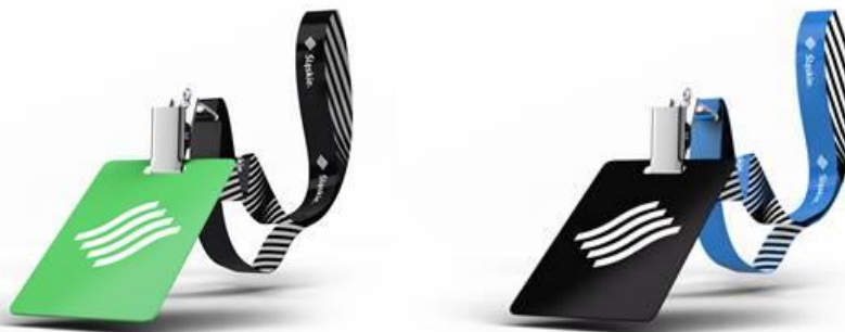
Poglądowe zdjęcie (smycz bez identyfikatora)