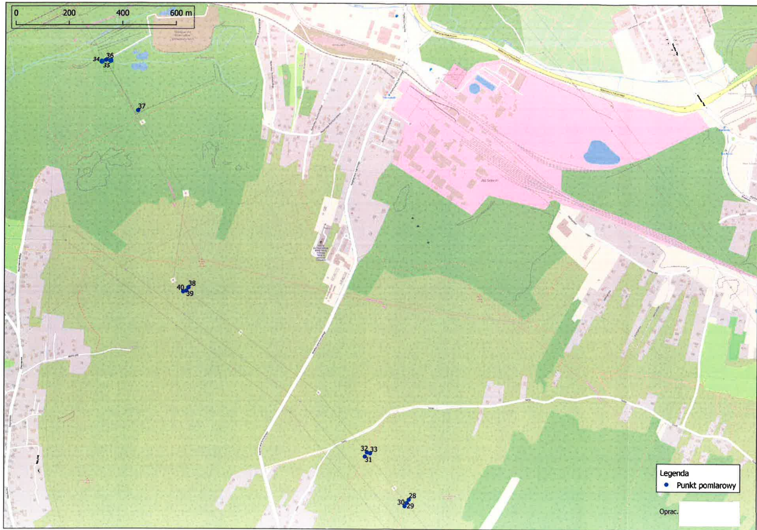
Rysunek 3 Lokalizacja pionów/punktów pomiarowych