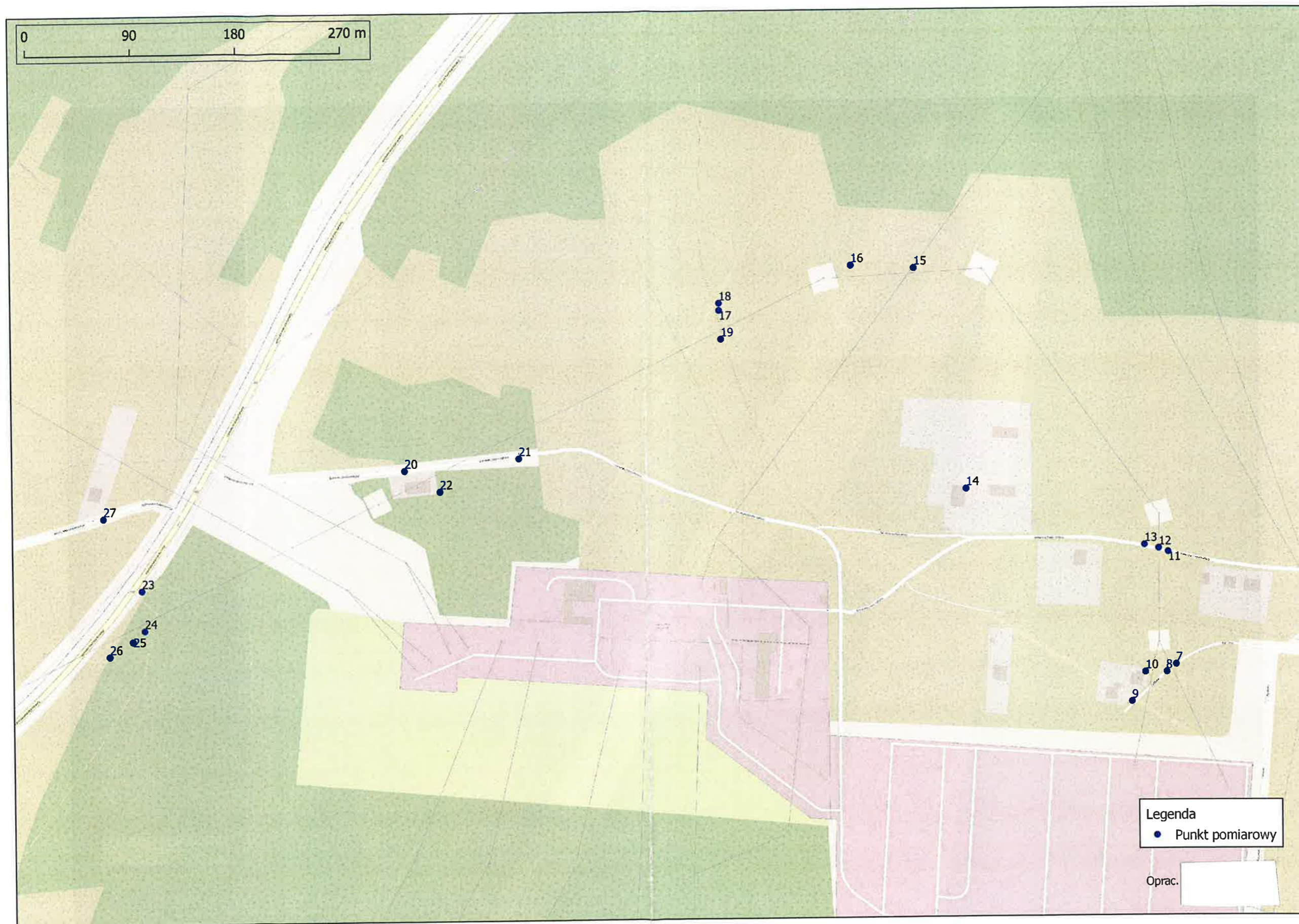
Rysunek 2 Lokalizacja pionów/punktów pomiarowych