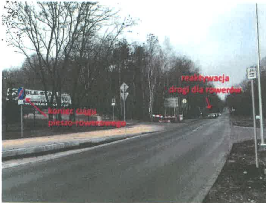
Zdj. 1 Brakujący odcinek drogi dla rowerów przy ul. Zwycięstwa (DW924)

Jednocześnie zwracam się z wnioskiem o udostępnienie listy planów przebudów dróg wojewódzkich na terenie powiatu gliwickiego wraz z informacjami czy gotowa jest już koncepcja lub projekt oraz jaki jest planowany termin ogłoszenia przetargu na prace budowlane.