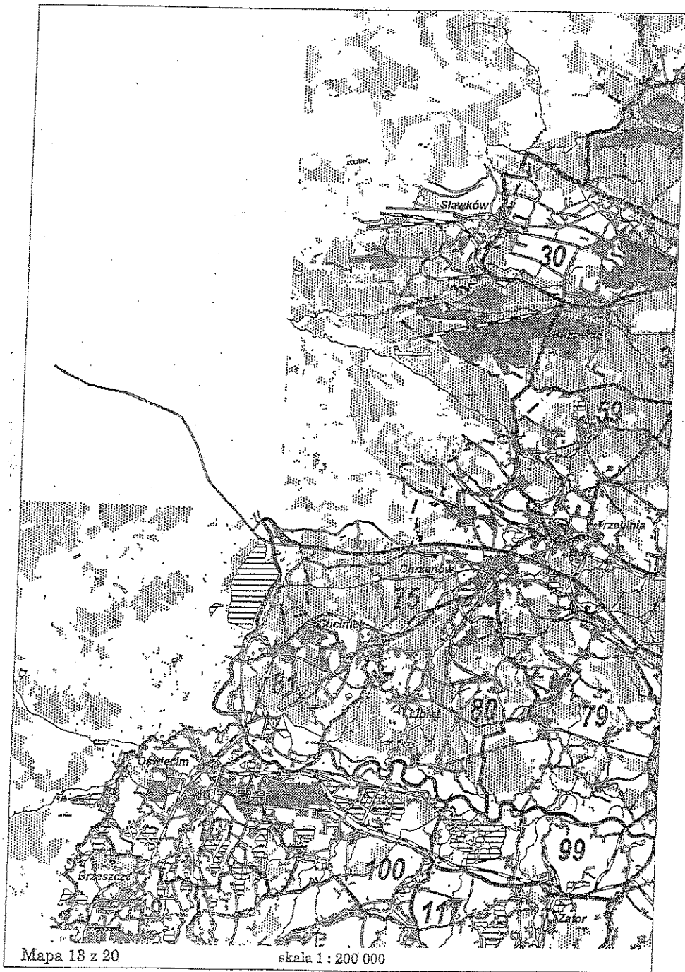
Mapa 18 z 20