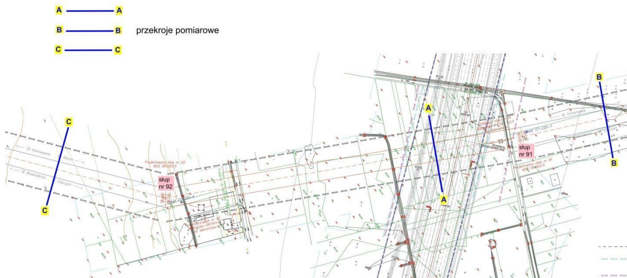
Rysunek 1. Przekroje pomiarowe natężenia pola-EM

Politechnika Wroclawska, 50-370 Wrocław, Wyb. Wyspiańskiego 27, fax: 71 3203189, tel. 71 3203087, 71 3202497; lwimp@pwr.wroc.pl