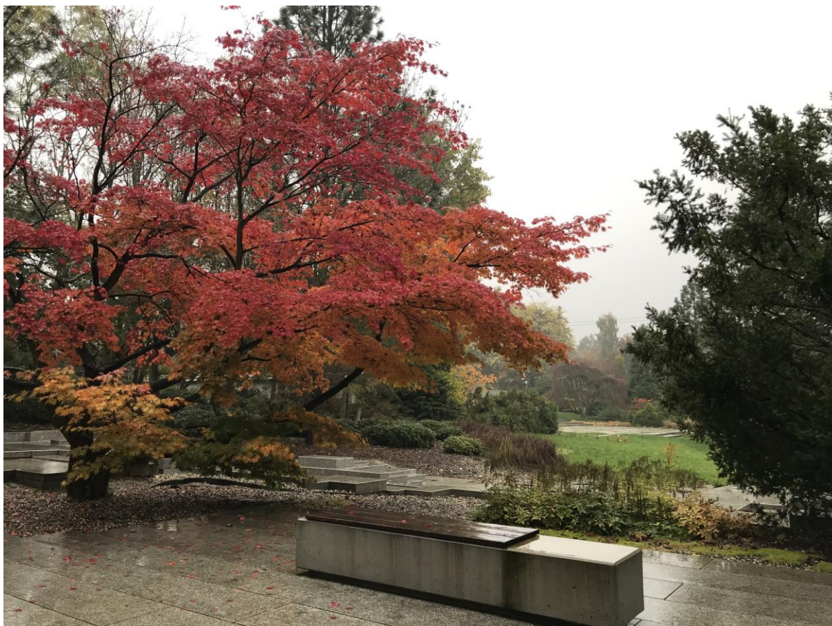
Fragment przebudowanego Ogrodu Japońskiego, oddanego dla zwiedzających w 2021 r. w stylu Tsukiyama.