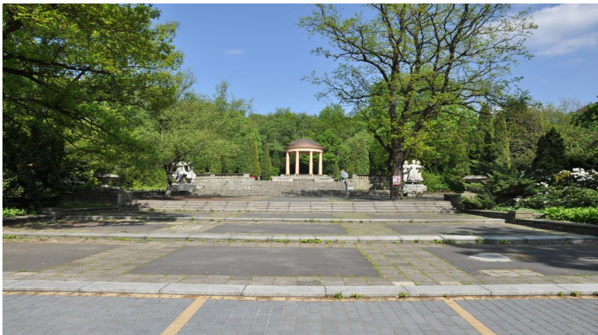
Wnętrze parkowe z charakterystycznymi elementami Parku Śląskiego - kręgiem tanecznym i Świątynią Dumania