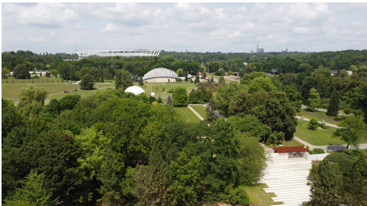
Fragment parku - widoczna niewielka dominanta Hali Kapelusz wraz z przedpołem ekspozycji oraz znaczna dominanta - Stadion Śląski