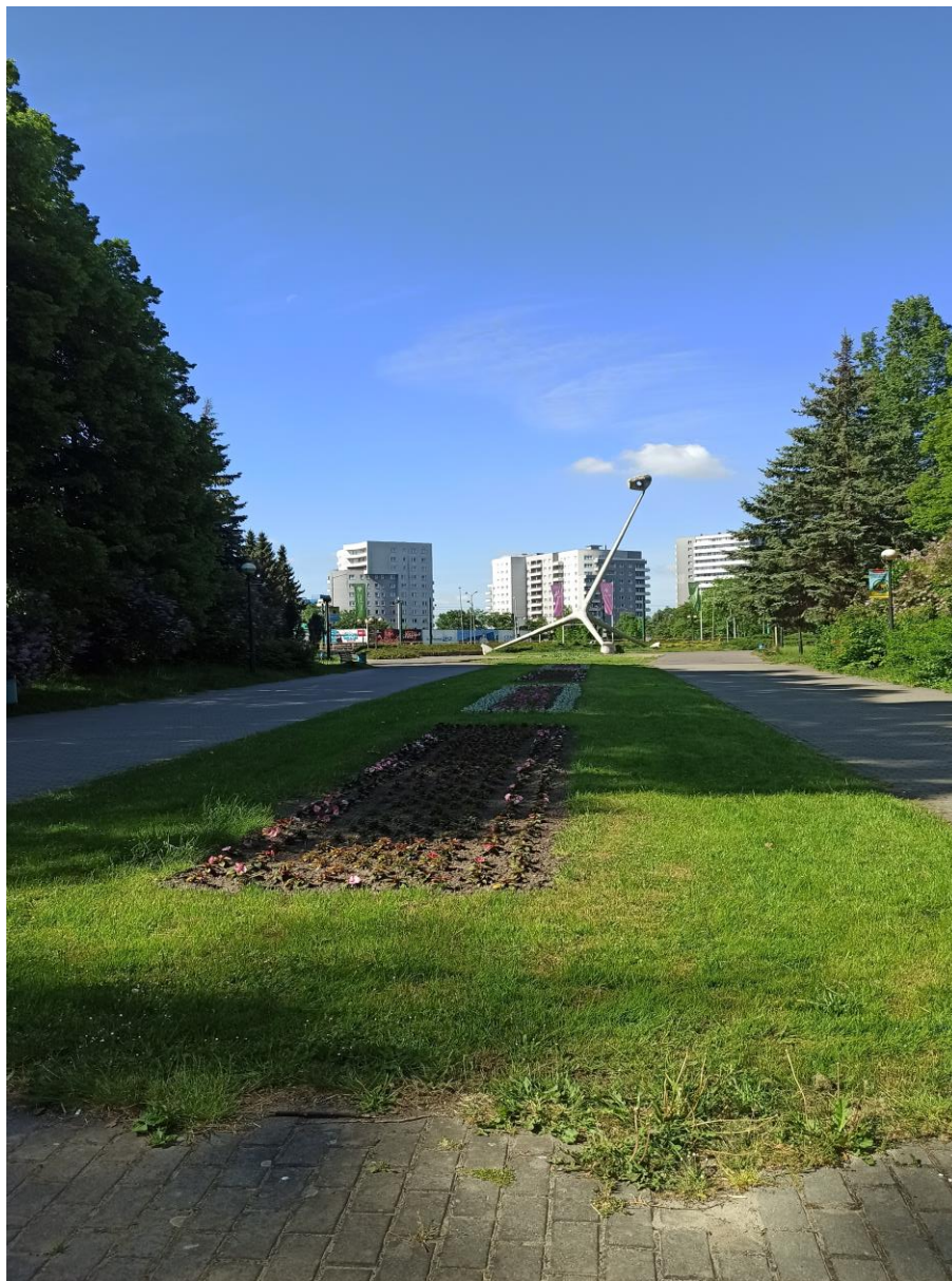
Aleja spacerowa - oś widokowa Parku – wejście od strony Żyrafy i Osiedla Tysiąclecia w Katowicach